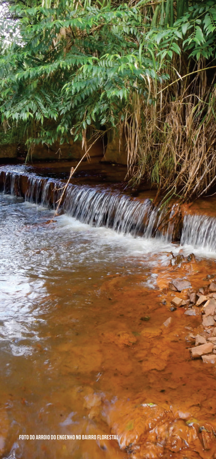
FOTO DO ARROIO DO ENGENHO NO BAIRRO FLORESTAL

LIMPE SUA FOSSA A CADA 2 ANOS. FOSSA LIMPA NÃO POLUI O ARROIO. ARROIO LIMPO NÃO POLUI O RIO.